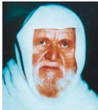
Nasir al-Din al-Albani, geb. 1914 in Albanien, gest. 1999 in Jordanien: Islamgelehrter und Verfasser zahlreicher religiöser Schriften; einflussreicher Vordenker salafistischer Lehrmeinungen.

a) Politikferne bzw. puristische Salafisten zeichnen sich durch die Unterlassung politischer Betätigung aus. Sie orientieren sich hierbei an einer Aussage des Gelehrten Nasir al-Din al-Albani, wonach die beste Politik darin bestehe, sich von der Politik abzuwenden. Vorrang haben für sie die Reinigung der Religion von unstatthaften Neuerungen sowie die Da'wa-Arbeit im Sinne der Missionierung. Darauf basierend folgt die Erziehung des Einzelnen und der Gemeinschaft im Sinne des vermeintlich „wahren“ Islam salafistischer Auffassung.